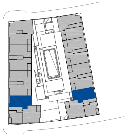
Portales A y H. Plantas 1ª, 2ª, 3ª, 4ª